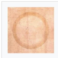
8) Die vollkommene Vergessenheit von Ochs und Hirte