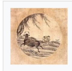
4) Das Fangen des Ochsen