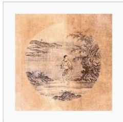
1) Die Suche nach dem Ochsen

Ken Wilber beschreibt eine eigene mystische Erfahrungen und erwähnt die 10 Ochsenbilder des Zen als Beispiel einer Landkarte des Aufwachens oder der Erleuchtung.