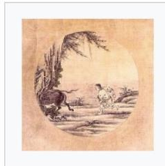
3) Das Finden des Ochsen