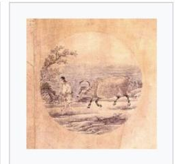
5) Das Zähmen des Ochsen