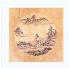
2) Das Finden der Ochsenspur