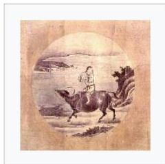
6) Die Heimkehr auf dem Rücken des Ochsen [d. h., das Ego wurde gezähmt]