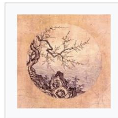
9) Zurückgekehrt in den Grund und Ursprung