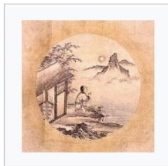
7) Der Ochse ist vergessen, der Hirte bleibt