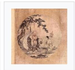
10) Das Hereinkommen auf den Markt mit offenen Händen